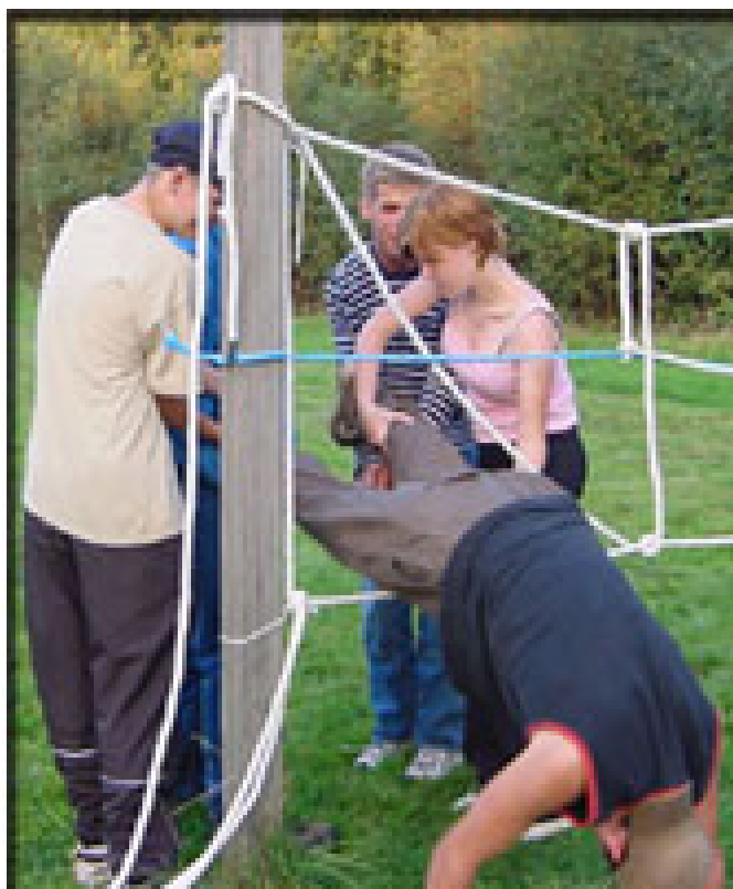
Samarbetsövningar under ett läger