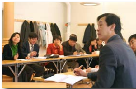
Delegationen från Shanghai besökte Göteborg för att lära mer om återvinning.